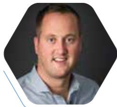
Herco Brand projectleider

“Problemen bestaan niet, uitdagingen ga ik aan. Daarom ben ik in mijn element bij opdrachtgevers die verwachten dat er pragmatisch en oplossingsgericht wordt meegedacht.”