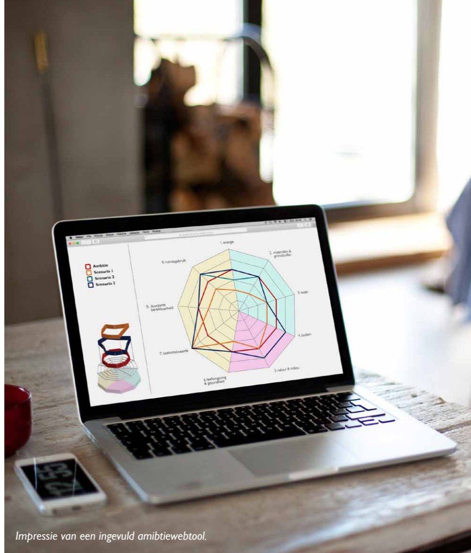
Impressie van een ingevuld ambitiewebtool.